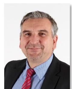
Rainer S. Taigel, Bürgermeister