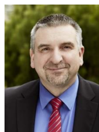
Rainer S. Taigel, Bürgermeister